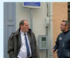
Jean CASTEX, Maire de Prades avec un agent de la police municipale

Le Maire de Prades souligne dans une interview, que vous verrez sur le stand de CEMAVIL au prochain SMCL, «...la souplesse du dispositif qui permet de programmer le suivi dans tous les sens et en fonction de nos besoins...» et qui permet «... si un jour nous voulons le faire évoluer de le faire par une simple reprogrammation du dispositif.»